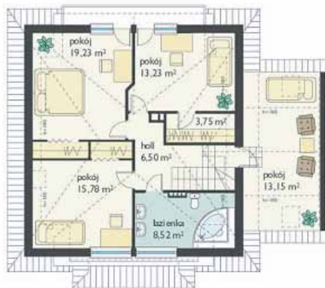
RZUT - PODDASZE