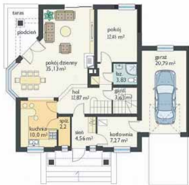
RZUT - PARTER

naszych domków jest wszechstronne i daje możliwość dowolnej aranżacji. Na parterze zaprojektowano salon z aneksem jadalnym i niewielkim podcieniem, półotwartą kuchnię ze spiżarnią, dodatkowy pokój z łazienką - oddzielony od części dziennej, kotłownię i garaż. Na poddaszu umieszczono trzy sypialnie, wygodną łazienką i dodatkowy pokój nad garażem. W budynku znajduje się niewielki strych (ok. 10 m 2 ) z możliwością wykorzystania jako pomieszczenie gospodarcze.